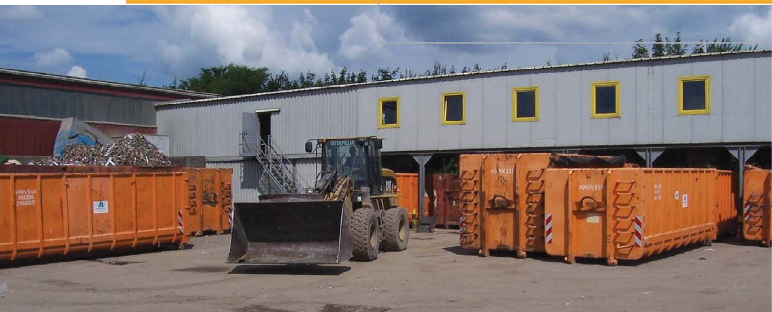
Sortieranlage in Düdenbüttel