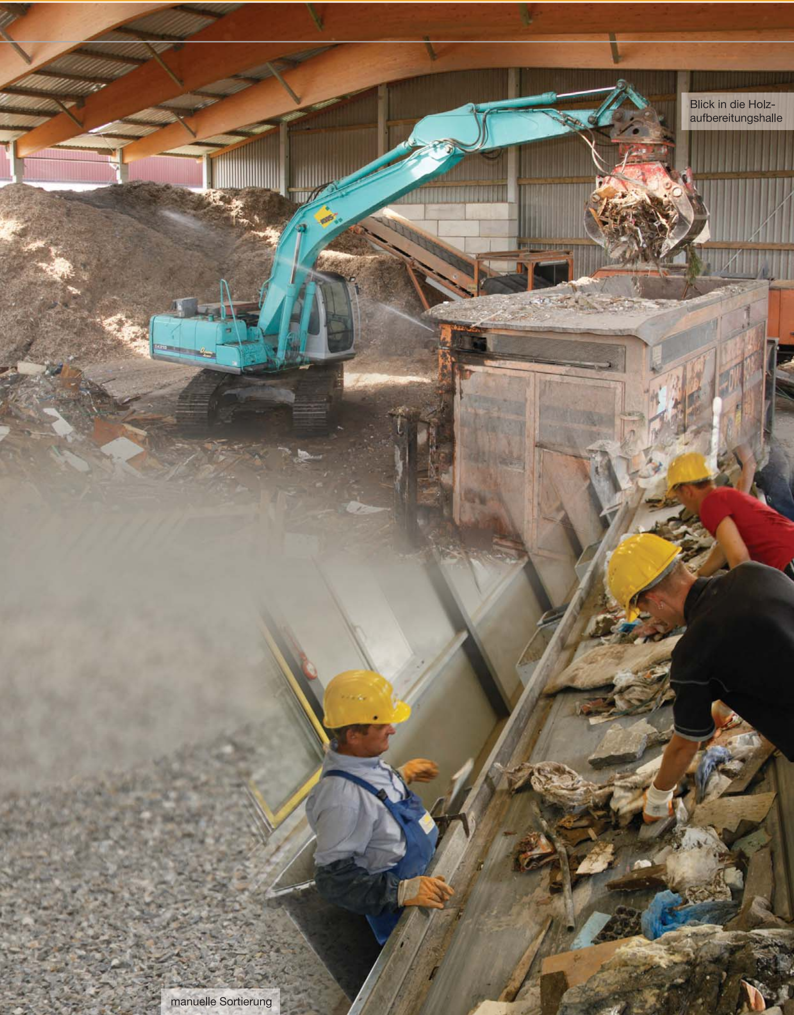
Blick in die Holz- aufbereitungshalle